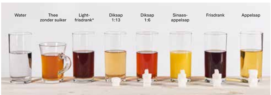
Hoeveelheid suiker in een glas van 150 ml

In frisdrank, (zelfgemaakt of versgeperst) sap, limonade en de meeste pakjes drinken zit veel suiker. Je kunt ze af en toe wel geven, bijvoorbeeld op speciale momenten zoals een verjaardag of een keer in het weekend, maar geef ze liever niet dagelijks.